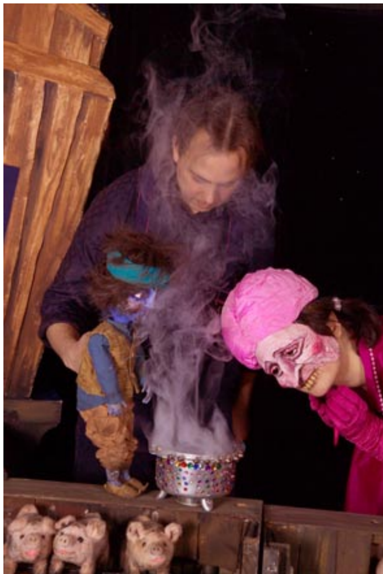
HC Andersens Svinherden visas av Musikteatret Undergrunden vid Festival of Wonder i Silkeborg i November.