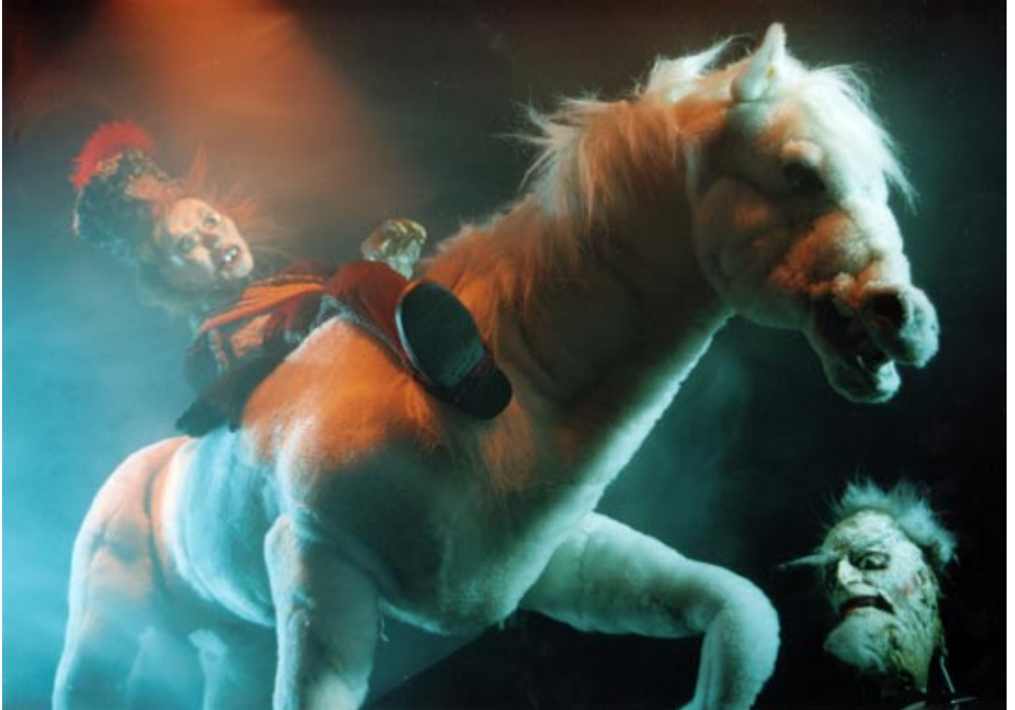
Ur Vampyria med spanska Teatro Corsario, som visas i Silkeborg 10-13 nov.